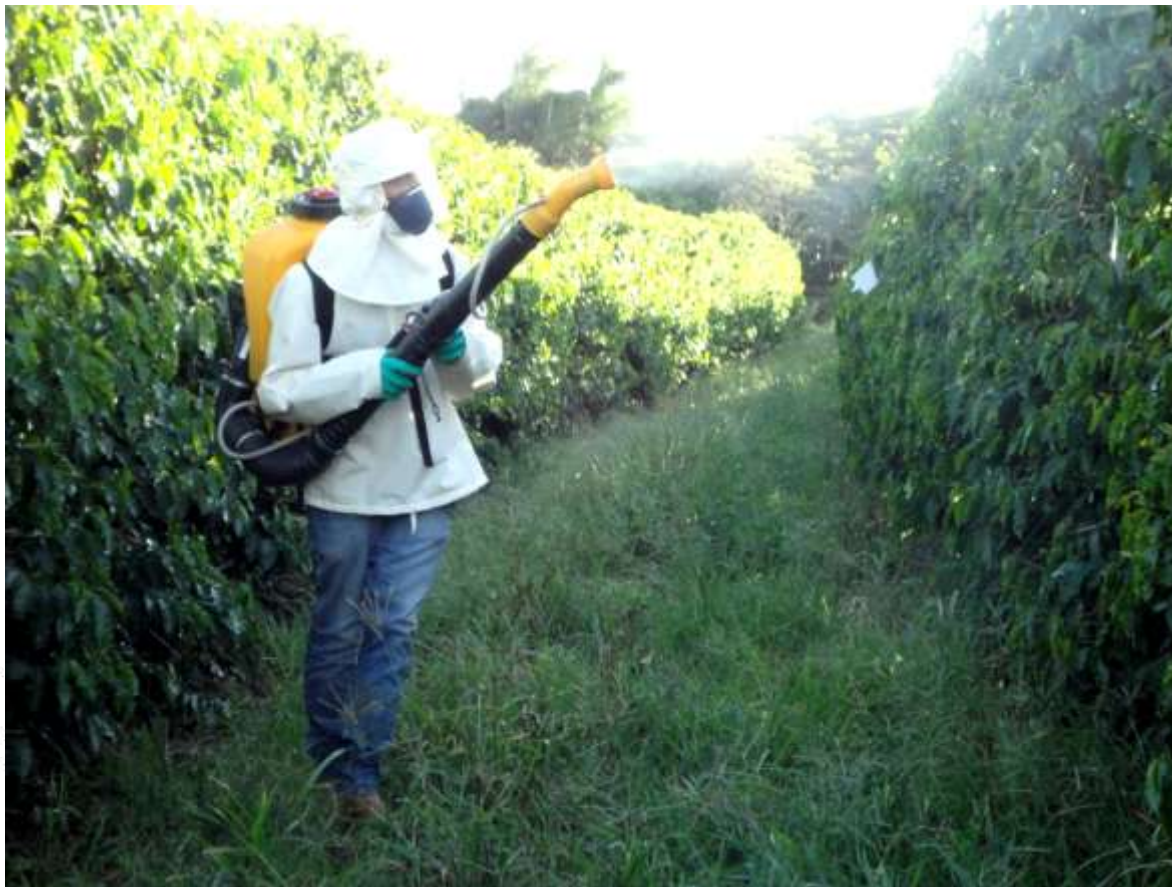
Imagem 3: As aplicações dos tratamentos foram realizadas com pulverizador tipo atomizador, costal, motorizado; sendo a vazão de 400 litro/hectare.