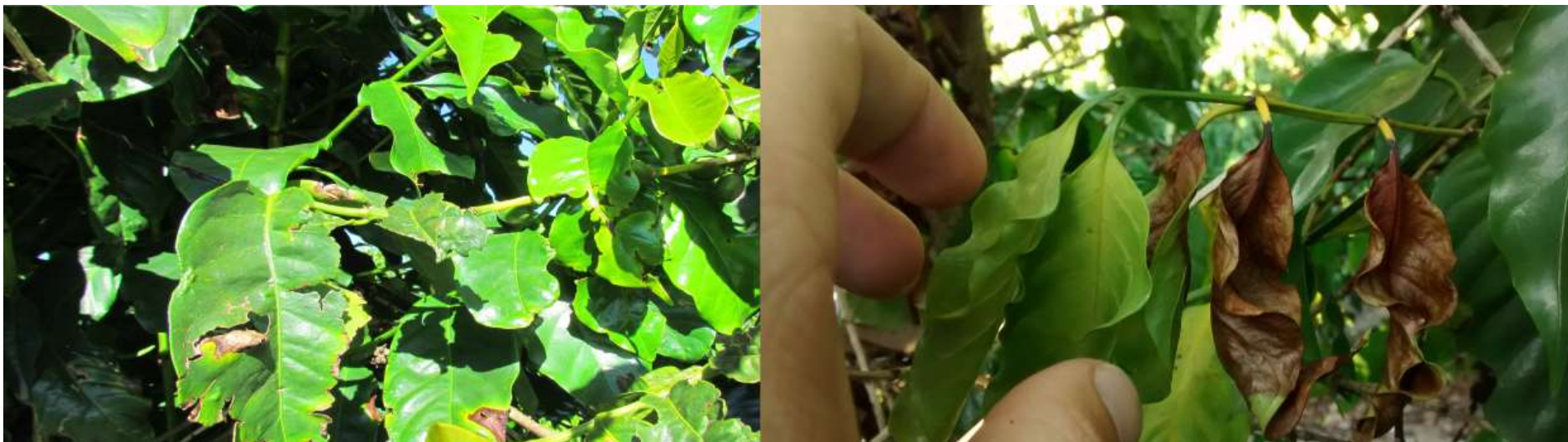
Imagem 2: A esquerda danos causados pela chuva de granizo, a direita ataque da bactéria no mês de Abril

As aplicações foram realizadas nas datas de 11/01/2014, posteriormente em 31/01/2014 logo após uma chuva de granizo e a última aplicação em 21/02/2014. Portanto, foram feitas três aplicações do produto, uma a mais que o programado em função da chuva de granizo.