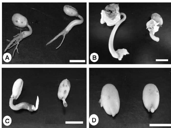
Figura 1 – Aspecto morfológico do crescimento radicular de sementes de Coffea arabica cv. Rubi germinadas in vitro , 41 dias após o início dos tratamentos. A) T1 – MS saís e vitaminas, suplementado com ágar 6 g L -1 e sacarose 20 g L -1 (controle); B) T2 – T1 suplementado com 6 mg L -1 de BAP mais 0,1 mg L -1 de ANA; C) T3 – T1 suplementado com 6 mg L -1 de BAP; D) T4 – T1 suplementado com 5 mg L -1 de GA 3 . Barras = 1 cm

Apesar de ter ocorrido a formação da alça hipocotiledonar com o tratamento T3, não foi observada a formação de um sistema radicular eficiente, já que essa formação não indicou um sistema radicular completamente formado (Figura 1C). Esses resultados corroboram os dados obtidos por Carvalho et al. (1998) que, trabalhando com embriões do cafeeiro cv. Acaíá, observaram que o BAP não exerce influência sobre o enraizamento.