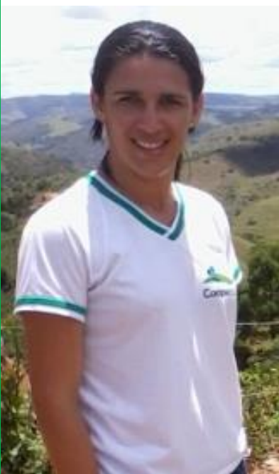
Figura 4 -Joara /Moradora do Santo Antonio II

“ Porque gosta da área, pela Barra ter um histórico com a cafeicultura e impregna na vida”