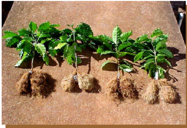
Figura 3 - Cafeeiros IAPAR-59 inoculados com Meloidogyne exigua .

De acordo com os resultados desses dois experimentos, a cultivar IAPAR 59 comportou-se como resistente ao nematóide exigua , tendo em vista a ausência de galhas e juvenis em todas as plantas, totalizando, nos dois experimentos, 152 sistemas radiculares ausentes deste nematóide, confirmando-se assim os trabalhos de (Fazuoli e Lordello (1998); Gonçalves e Pereira (1998), Bertrand (1999) e Bertrand e Aguilar (1998).