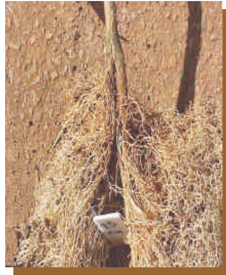
Figura 2 - Sistema radicular bifurcado (split-root).