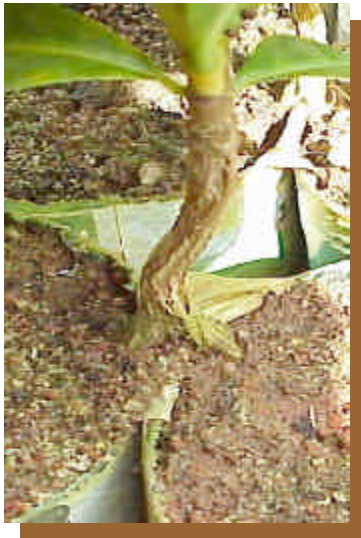
Figura 1 - Cafeeiro em sistema split-root.

calculando-se o fator de reprodução FR ( Pf/Pi ). As raízes foram lavadas e submetidas à técnica de Hussey e Barker (1973), para extração de ovos.