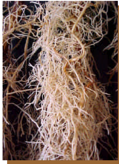
Figura 5 - Raízes sem galhas da cultivar IAPAR 59.