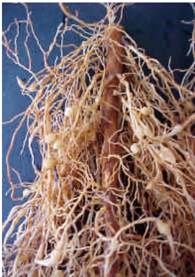
Figura 4 - Raízes com galhas da cultivar Catuaí.