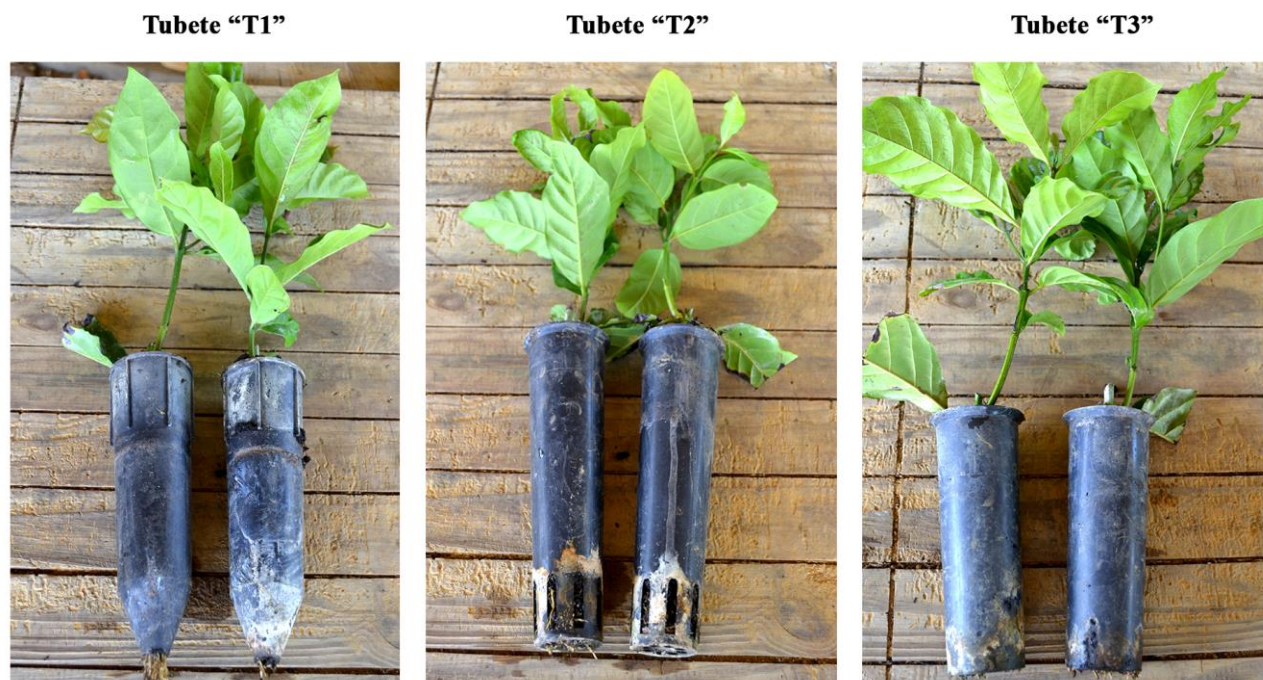
Figura 3. Comparação entre o desenvolvimento foliar de mudas de café Conilon produzidas com tubetes com diferentes formatos (T1, T2 e T3), aos 126 dias de desenvolvimento (Marilândia, Espírito Santo, 2016) (Fonte: os autores).

Entretanto, mudas produzidas nos três tipos de tubete não se diferenciaram em termos do teor de clorofila total (Figura 2E), nem alterou a relação de clorofilas a/b (Figura 2F). A pequena alteração no teor de clorofila b entre os tipos de tubete não foi suficiente para causar mudanças nesses parâmetros, visto que o teor de clorofila a (mais abundante nos tecidos) foi mais determinante.