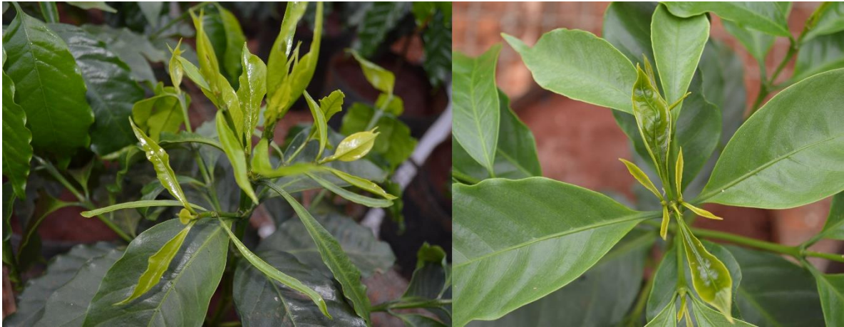
FIGURA 1 Estreitamento do limbo foliar, clorose e excesso de brotações nas regiões das gemas axilares de cafeeiros submetido ao herbicida Glyphosate. Lavras, 2019.