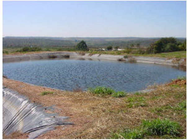
Figura 2 - Sistema de aspersão em malha em funcionamento e lagoa de tratamento dos dejetos líquidos.

O delineamento experimental foi o de blocos ao acaso; foram realizados quatro tratamentos, com cinco repetições, totalizando 20 parcelas: